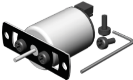
Part # MRK-3

Der Ecofanmotor wurde für eine Laufzeit über mehrere Heizperioden und unter normalen Bedingungen entwickelt. Sollte der Ecofan sich wesentlich langsamer drehen oder das Ventilatorblatt einen Anstoß benötigen um anzulaufen – kann ein einfacher Tausch des Ventilatormotors die Lösung sein.